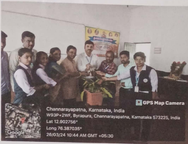
Channarayapatna, Karnataka, India W93P+2WF, Byrapura, Channarayapatna, Karnataka 573225, India Lat 12.902756° Long 76.387035° 26/03/24 10:44 AM GMT +05:30