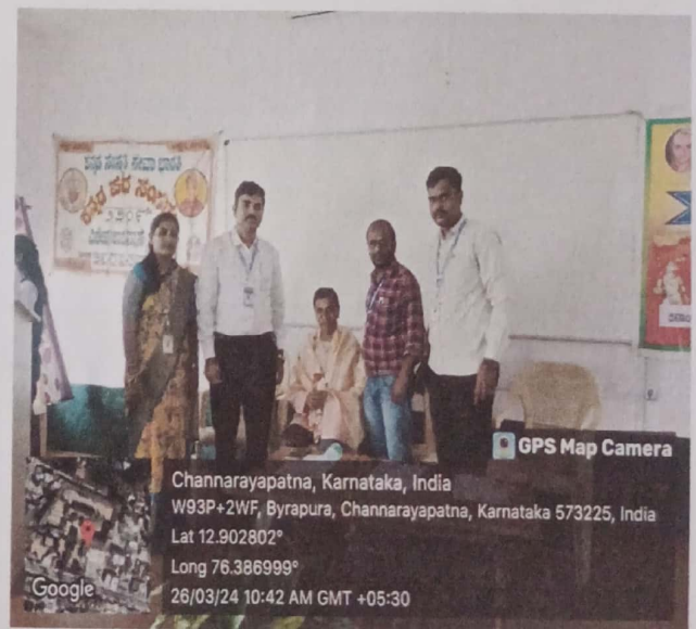
Channarayapatna, Karnataka, India W93P+2WF, Byrapura, Channarayapatna, Karnataka 573225, India Lat 12.902802° Long 76.386999° 26/03/24 10:42 AM GMT +05:30

A special lecture programme – Kannada Pada Sampattu.