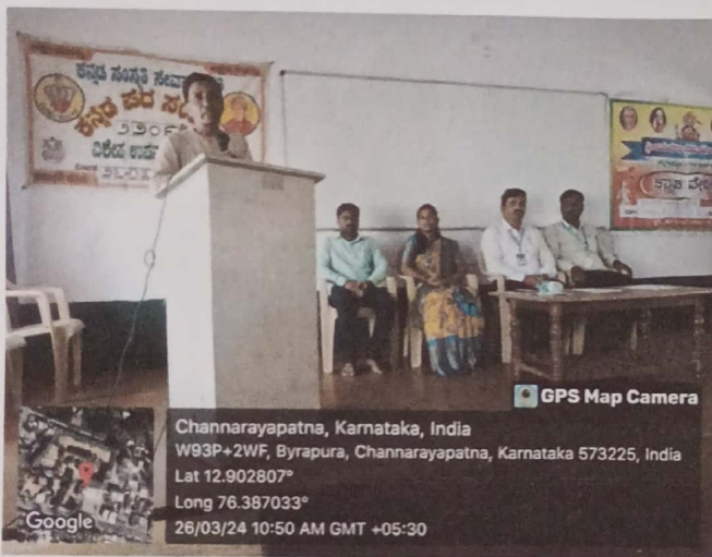
Channarayapatna, Karnataka, India W93P+2WF, Byrapura, Channarayapatna, Karnataka 573225, India Lat 12.902807° Long 76.387033° 26/03/24 10:50 AM GMT +05:30