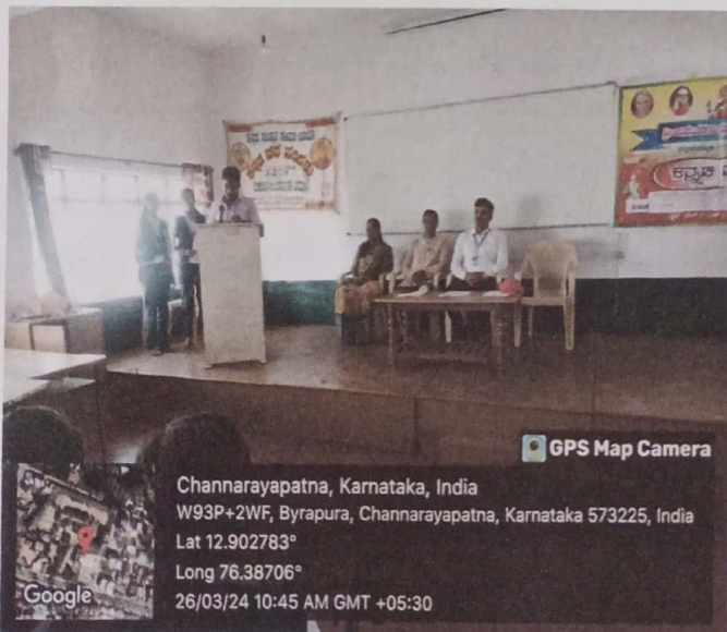
Channarayapatna, Karnataka, India W93P+2WF, Byrapura, Channarayapatna, Karnataka 573225, India Lat 12.902783° Long 76.38706° 26/03/24 10:45 AM GMT +05:30