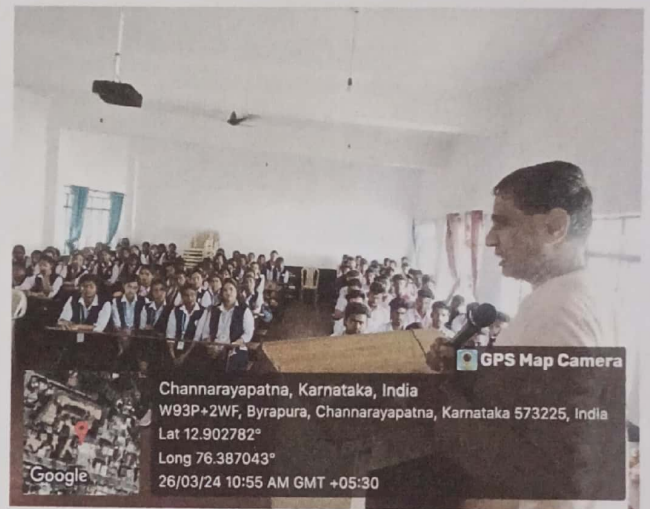
Channarayapatna, Karnataka, India W93P+2WF, Byrapura, Channarayapatna, Karnataka 573225, India Lat 12.902782° Long 76.387043° 26/03/24 10:55 AM GMT +05:30