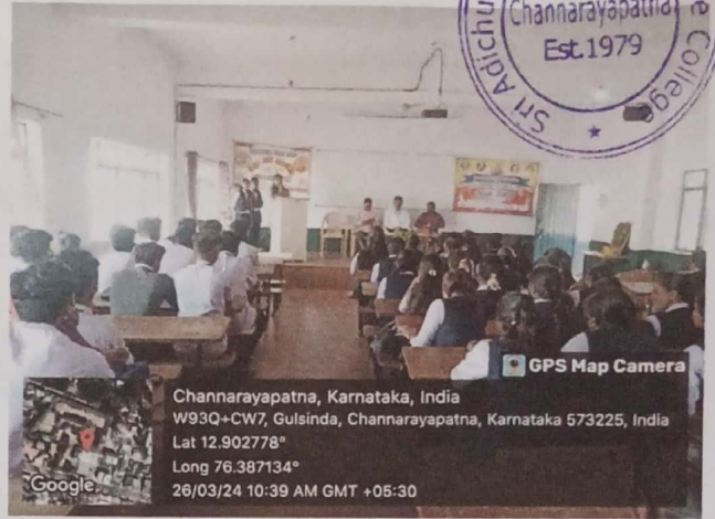
Channarayapatna, Karnataka, India W93Q+CW7, Gulsinda, Channarayapatna, Karnataka 573225, India Lat 12.902778° Long 76.387134° 26/03/24 10:39 AM GMT +05:30